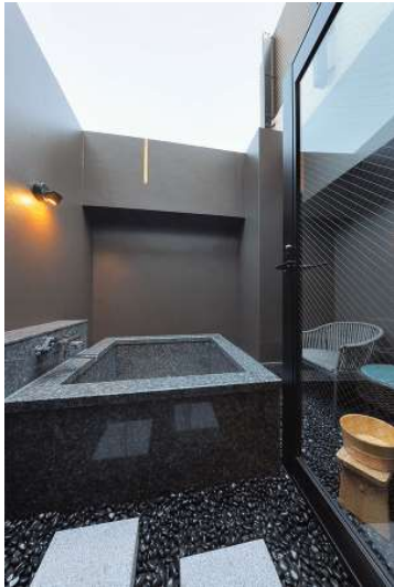
「Courner Suite」の露天風呂（東京浅草）