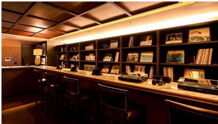
ロビー内のBar（横浜馬車道）