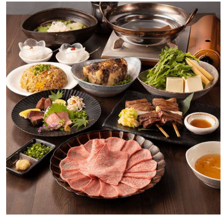
「小滝野」のディナーコース