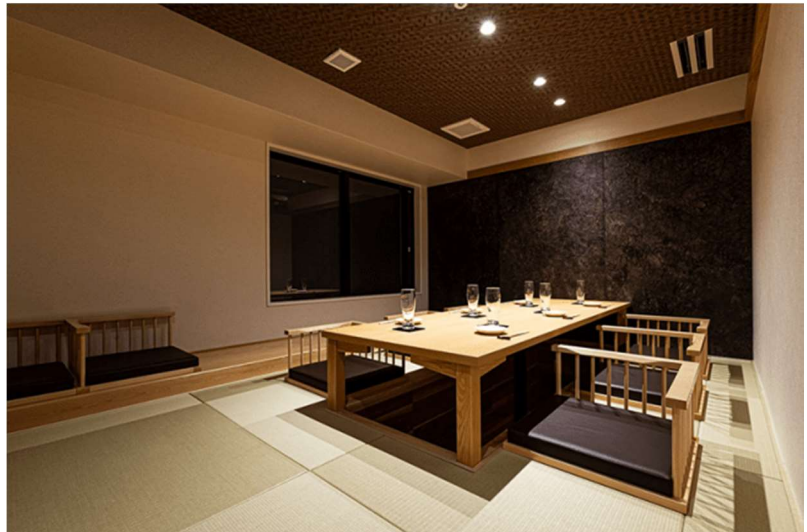
旅館内に併設するレストラン「小滝野」の個室（東京浅草）